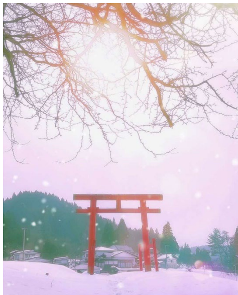
『あつと五城目』投稿作品