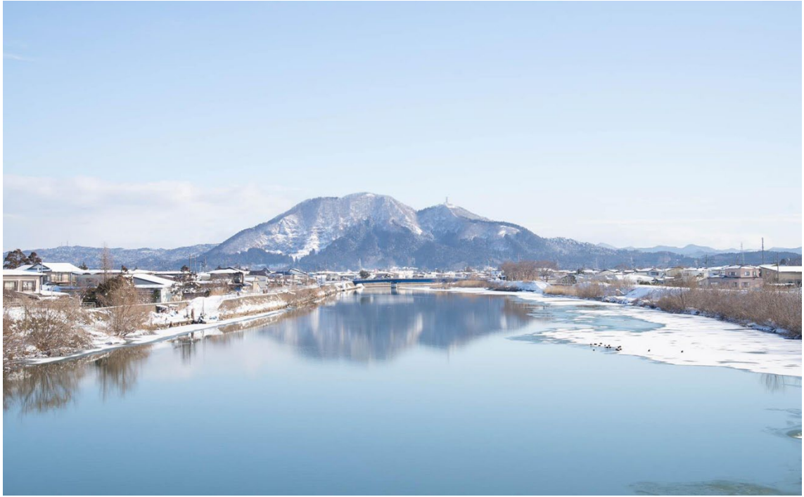
馬場目川から五城目町を望む