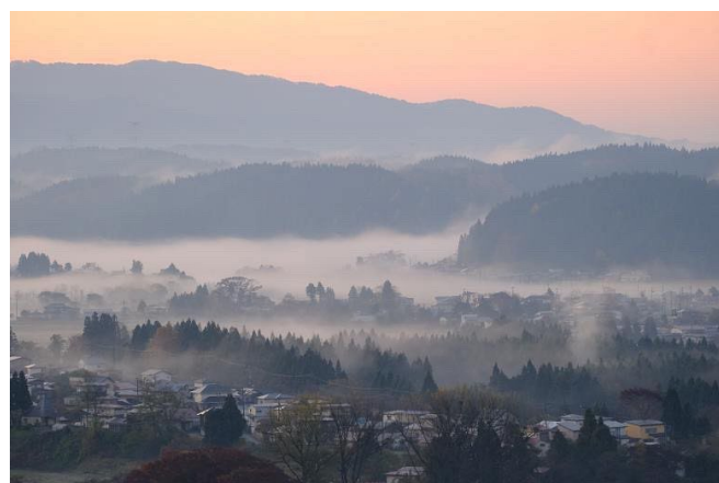
『あつと五城目』投稿作品