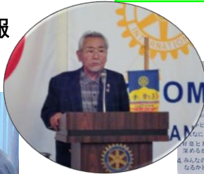
今年度・初例会で盛り上がりました。