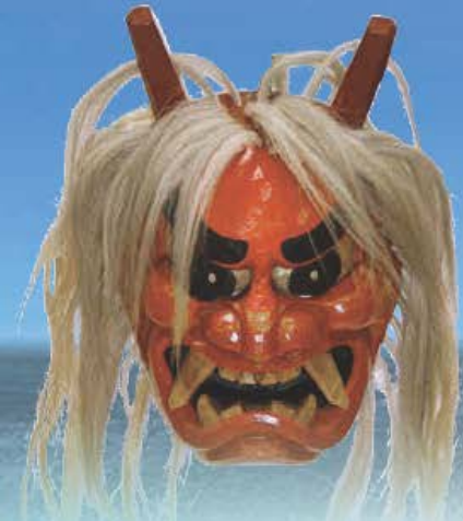
ユネスコ無形文化遺産「男鹿のナマハゲ」