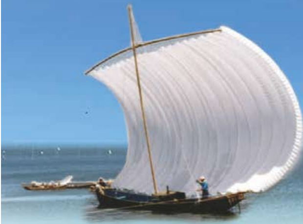
八郎湖の「うたせ舟」漁