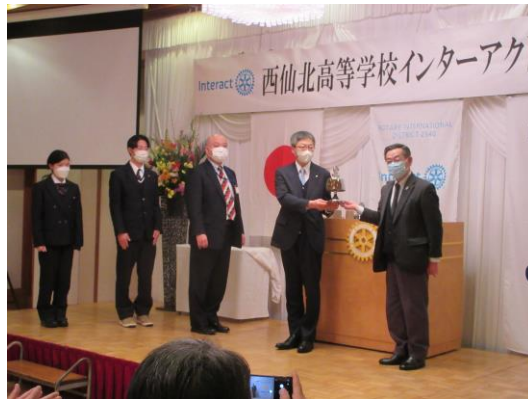
地区で準備 した点鐘と バッチ、旗を 淡路会長エレ クトより贈ら れました