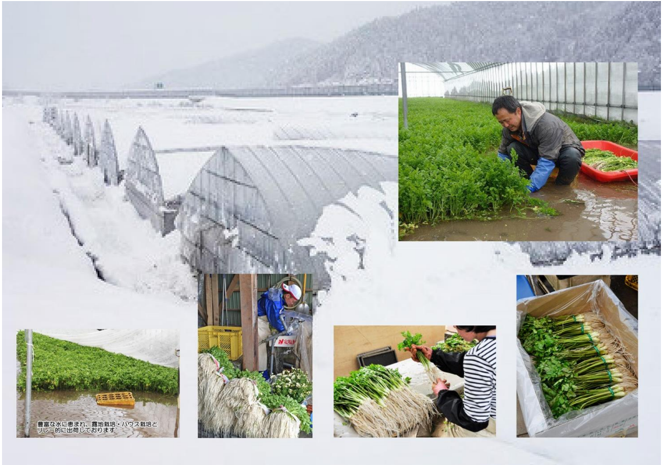
豊富な水に恵まれ、露地栽培・ハウス栽培と リレー的に出荷しております