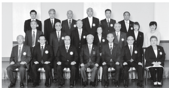
2015年9月30日(水)田沢湖ロータリークラブ、角館ロータリー