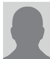
能代ロータリークラブ 柳 谷 悦 磨

表彰分類：米山功労者 マルチプル 2回目 ロータリー歴：1997年1月入会 2011-2012年度 クラブ幹事