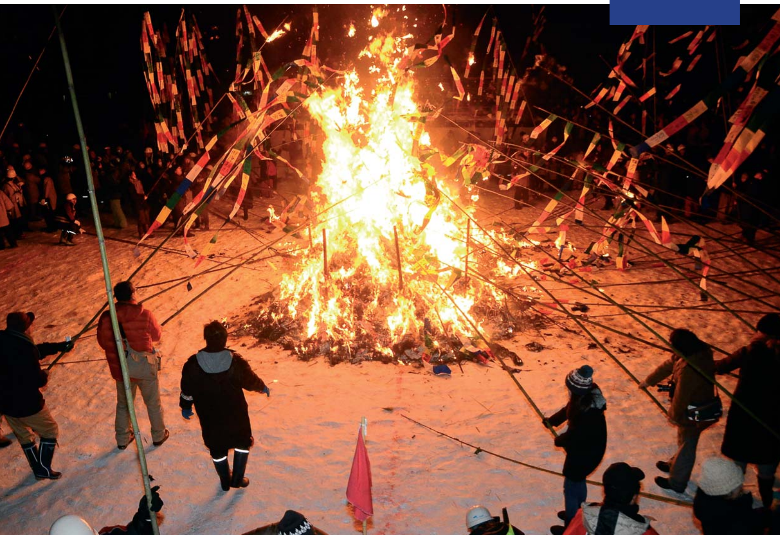
六郷のカマクラ 天筆焼き