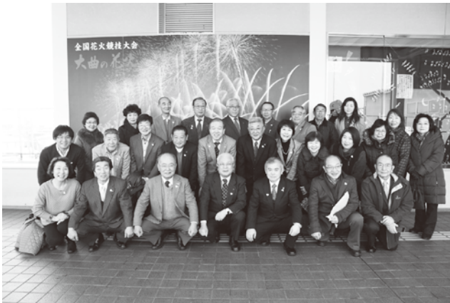
見送りの方々と 1月13日

新年度のテーマ「インスピレーションになろう」を基に2540地区ロータリアンの皆様方の御協力を得ながら次年度活動したいと思います。