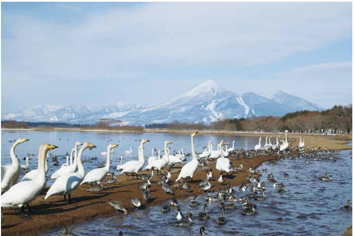
猪苗代湖・磐梯山