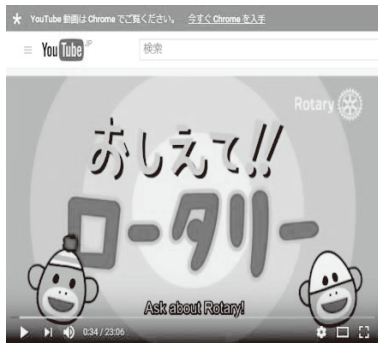
おしえてロータリー