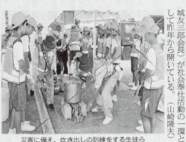
災害に備え、炊き出しの訓練をする生徒ら

倉敷市玉島地区の中学生が学ぶ「災害ボランティアリーダー研修会」が2日、同市玉島八島の玉島消防署で開かれた。玉島東、西、北、船越中の4中学校から30人が参加。災害に備え、炊き出しや搬送訓練などを行った。