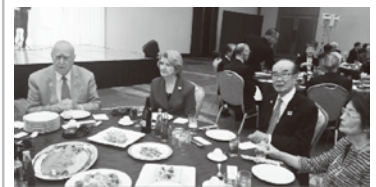
ジョン・F・ジャームRI会長ご夫妻 斎藤直美RI理事ご夫妻 名古屋ロータリー研究会 2016年11月29日

ロータリー研究会とは、ゾーン単位で開催され(日本は3つのゾーン合同)国際ロータリーの現、次期、元役員に国際ロータリーとロータリー財団の最新の情報を提供し、親睦と研修の機会を提供する会です。