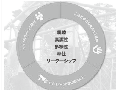
ロータリーの戦略計画と目標